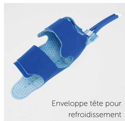
Enveloppe tête pour refroidissement