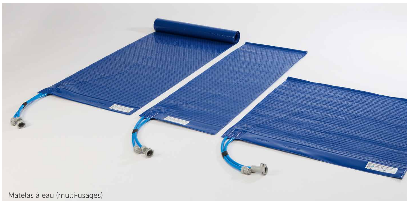
Matelas à eau (multi-usages)

Accessoires essentiels pour assurer un contrôle optimal de la température du patient